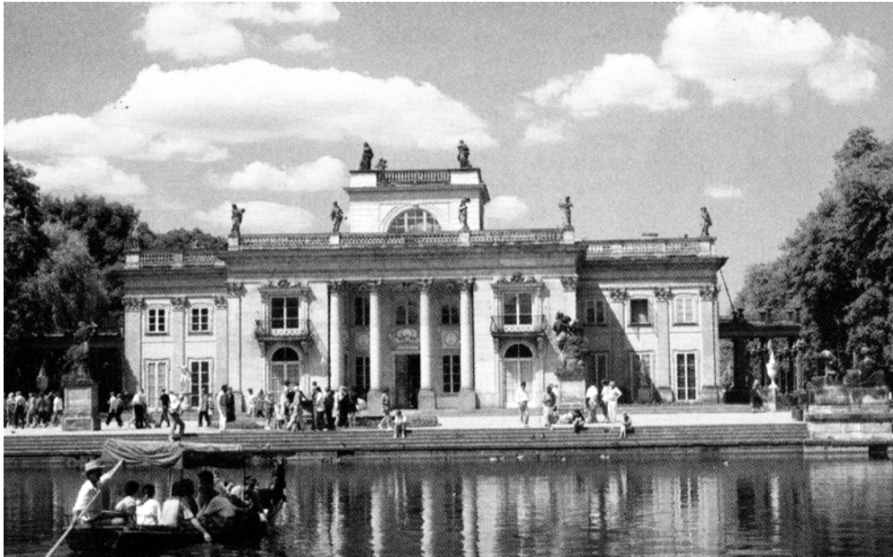
Łazienki Królewskie, pałac Na Wodzie, [w:] Nowa encyklopedia powszechna PWN, Warszawa 1998.

Na podstawie ilustracji oceń, czy zdania są prawdziwe. Zaznacz TAK lub NIE.