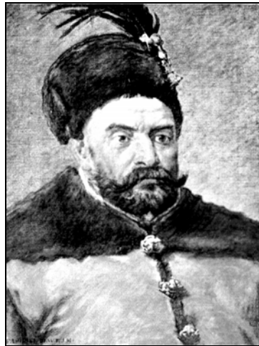
Stefan Batory 1533–1586