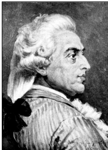
Stanisław August Poniatowski 1732–1798

Jan Matejko, Poczet królów i książąt polskich , Warszawa 1996.