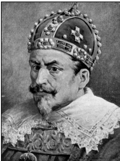
Zygmunt III Waza 1566–1632