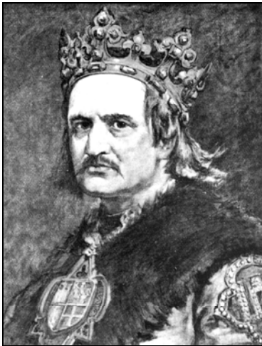
Władysław II Jagiełło 1348–1434

Na podstawie ilustracji i ich podpisów wykonaj zadania 19. i 20.