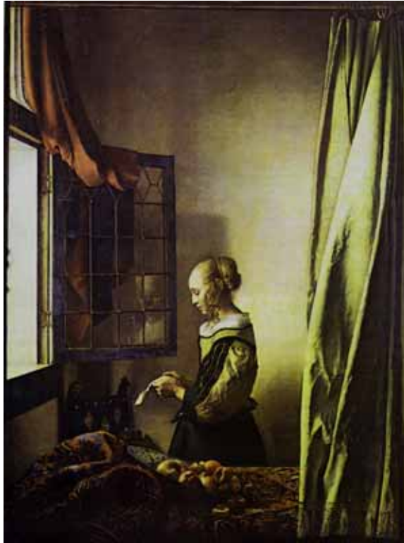
Jan Vermeer van Delft, Dziewczyna czytająca list , ok. 1657 r., olej na płótnie, 83 x 64,5 cm, Galeria Drezdeńska