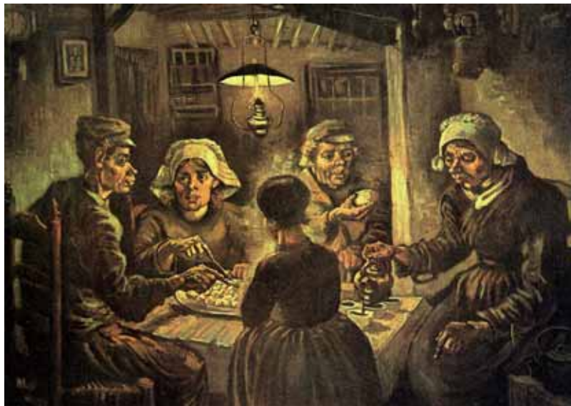
Vincent van Gogh, Jedzący kartofle , 1885 r., olej na płótnie, 81,5 x 114,5 cm, Stedelijk Museum, Amsterdam