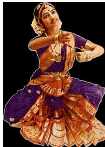
1.4 Bharata natyam