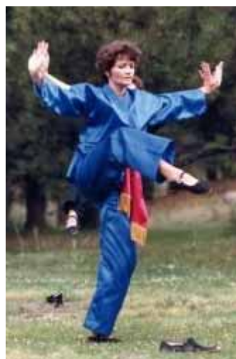
12.4 tai chi