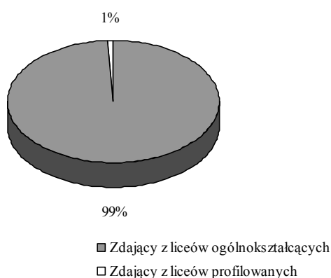
Wykres 1. Zdający maturę z historii muzyki a typ szkoły

Spośród zdających historię muzyki większość (65 abiturientów liceów ogólnokształcących) wybrało egzamin na poziomie podstawowym. Na poziomie rozszerzonym historię muzyki zdawało 38 osób 2 .